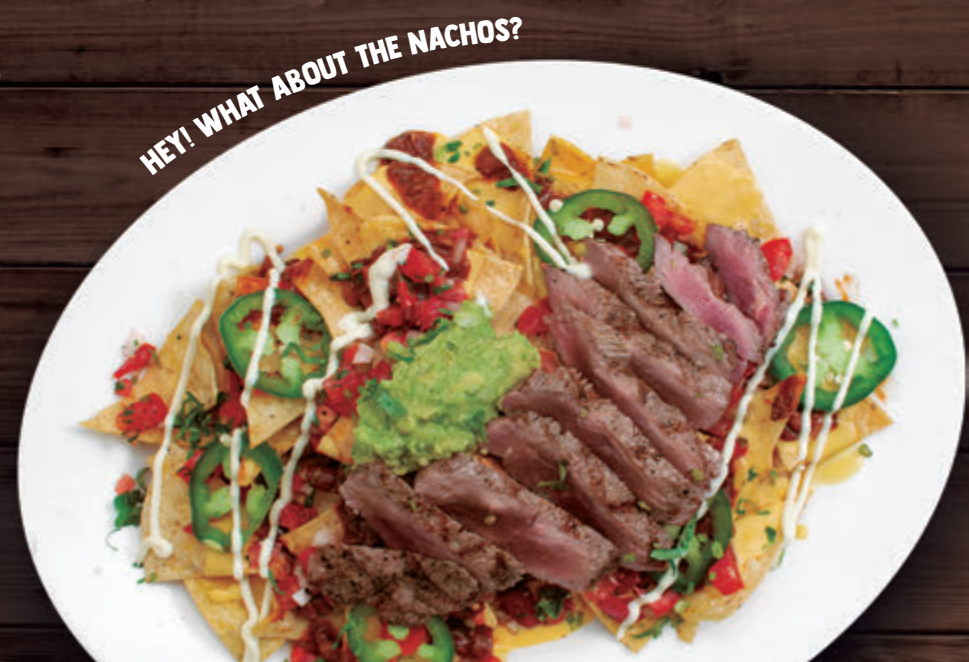
HEY! WHAT ABOUT THE NACHOS?

el clásico bowl de chili beans con carnitas de pulled pork, acompañado de nuestro pan hecho en casa 49