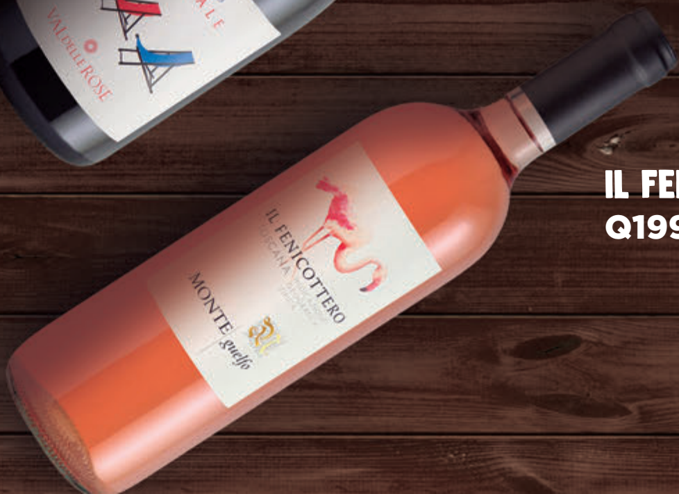
IL FENICOTTERO Q199