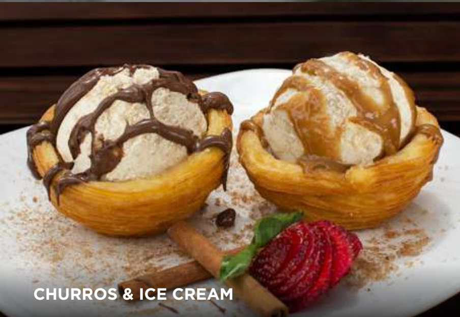
CHURROS & ICE CREAM

2 canastas de churros hechos en casa, servidos con una bola de helado de vainilla, chocolate, nutella o salted caramel y rellenas a tu elección de nutella, cajeta, mermelada de manzana o piña 35