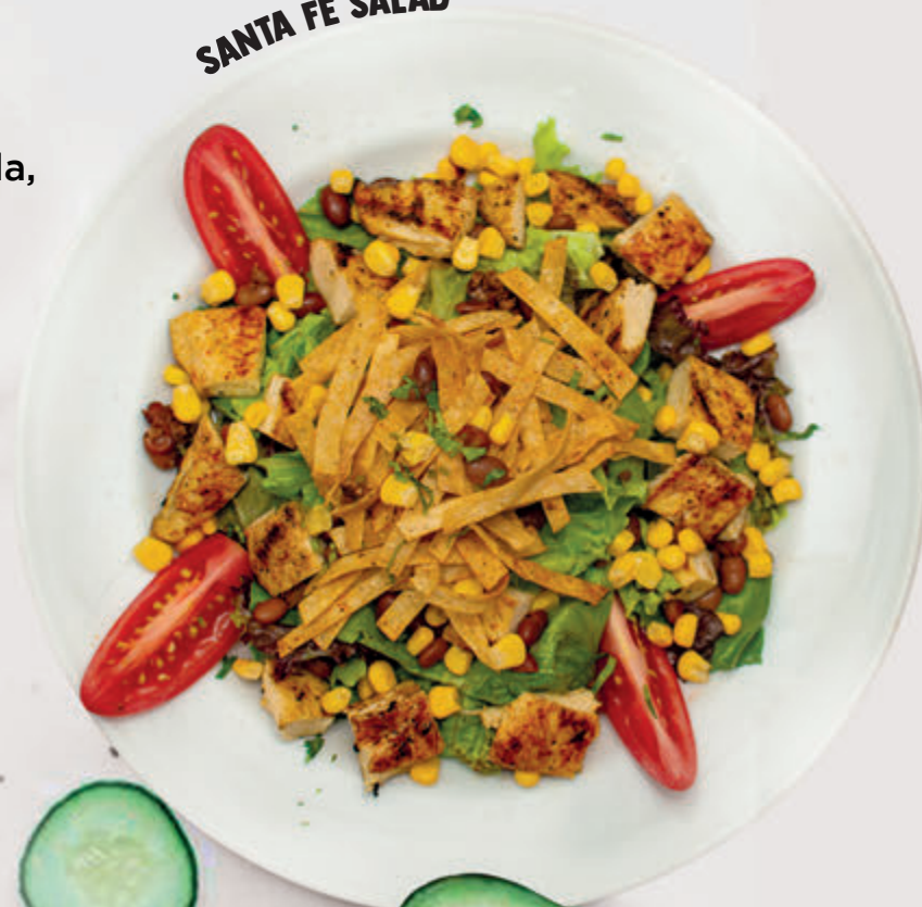
SANTA FE SALAD