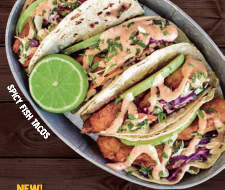
SPICY FISH TACOS