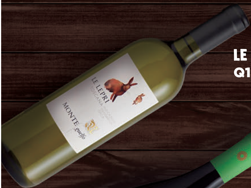
LE LEPRI Q199