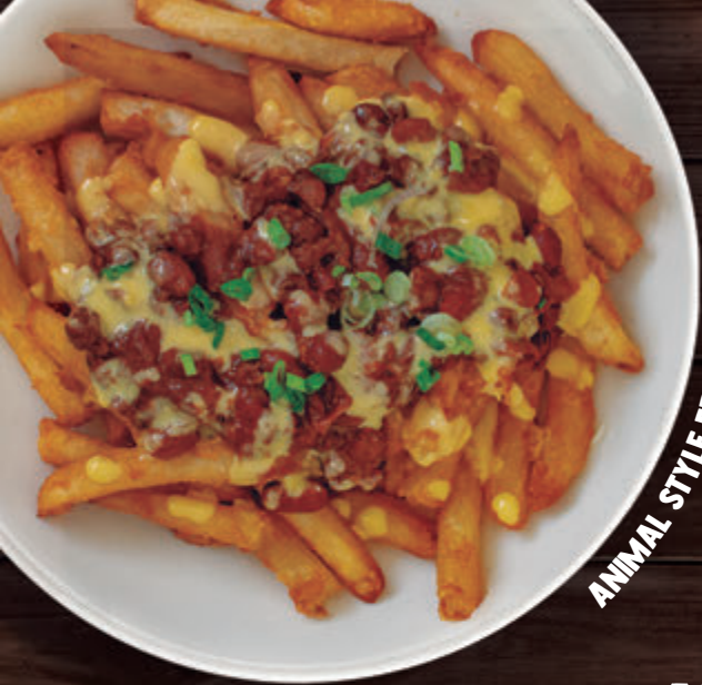
ANIMAL STYLE FRIES