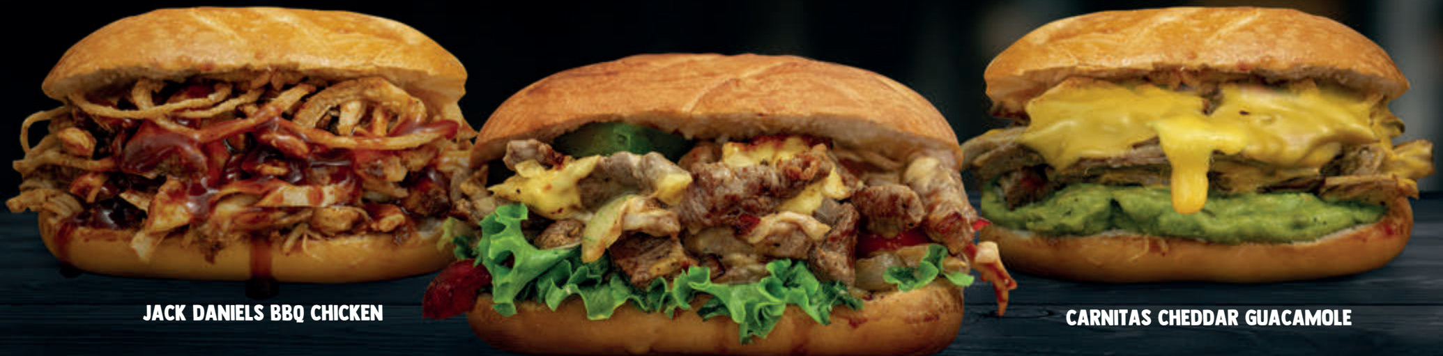
JACK DANIELS BBQ CHICKEN

pollo deshebrado o carnitas con Jack Daniels bbq y cebollitas crispy 59